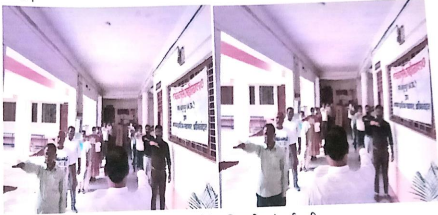
मतदाता जागरूकता शपथ लेते अधिकारी एवं कर्मचारी